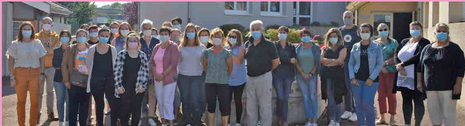
Enseignantes, agents communaux, Monsieur le Maire et quelques élu(e)s.

Finies les vacances ! Il est temps de reprendre le chemin de l'école.