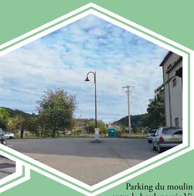
Parking du moulin entre la boulangerie Vial et le moulin coopératif