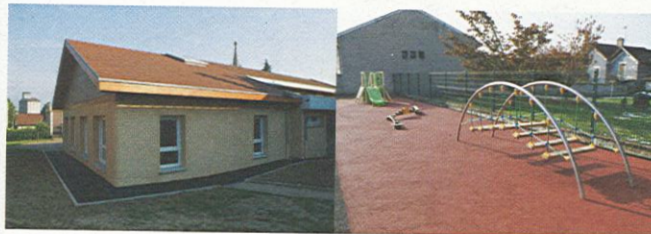
Création d'une classe en maternelle