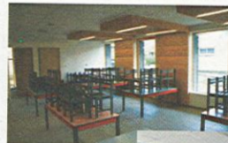
Nouveaux réfectoires, cuisine et classes