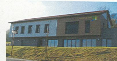
Maison de l'Hien et bibliothèque

Voilà quatre réalisations qui répondent aussi au défi d'un développement communal de qualité.